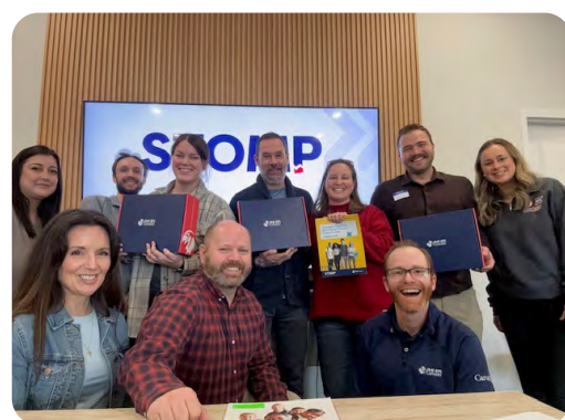
Photos d'ateliers MÉGOT dans le district scolaire anglophone Est.