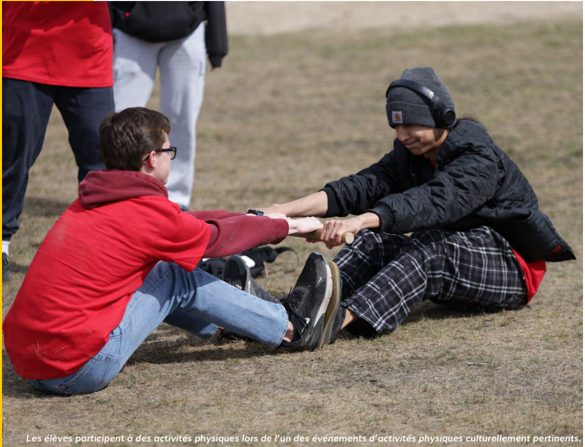
Les élèves participent à des activités physiques lors de l'un des événements d'activités physiques culturellement pertinents.