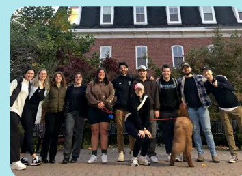
Section étudiante de l'Université St. Francis Xavier