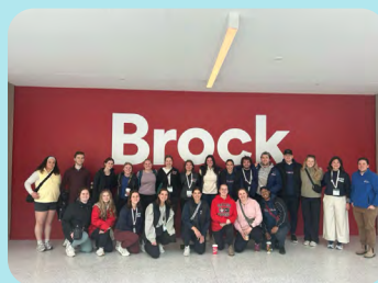
Section étudiante de l'Université Brock