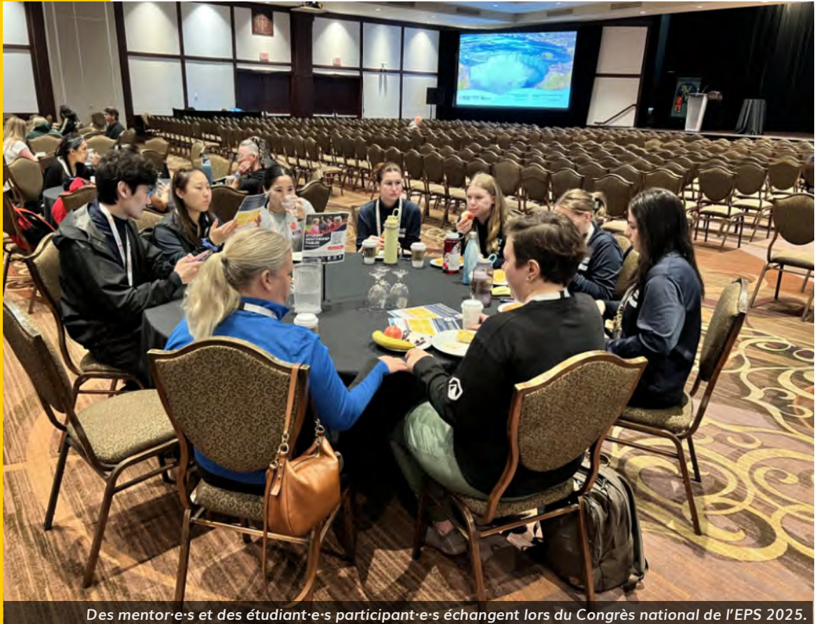
Des mentor·e·s et des étudiant·e·s participant·e·s échangent lors du Congrès national de l'EPS 2025.