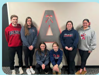
Section étudiante de l'Université Acadia