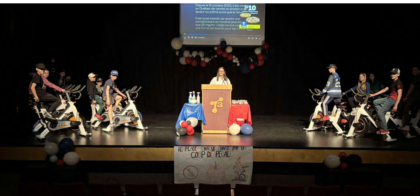
Une initiative MÉGOT dans une école encourage les élèves à remplacer le vapotage par l'activité physique.