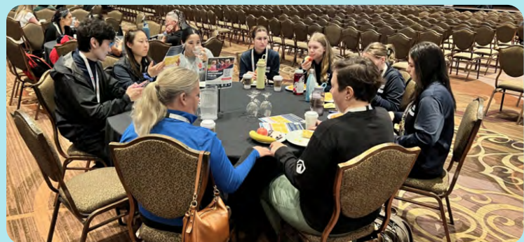
Moment de mentorat au Congrès national de l'EPS 2025