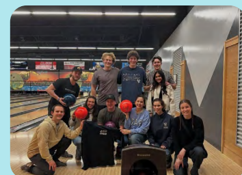
Section étudiante de l'Université de Victoria