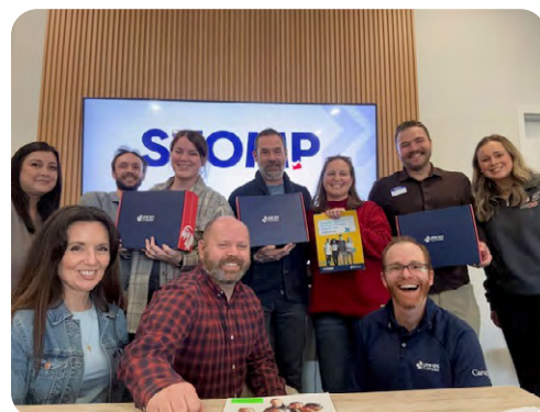
Photos d'ateliers MÉGOT dans le district scolaire anglophone Est.