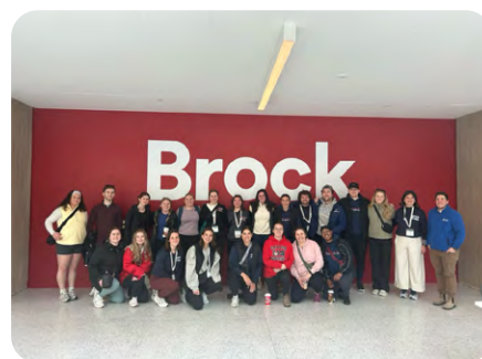
Section étudiante de l'Université Brock