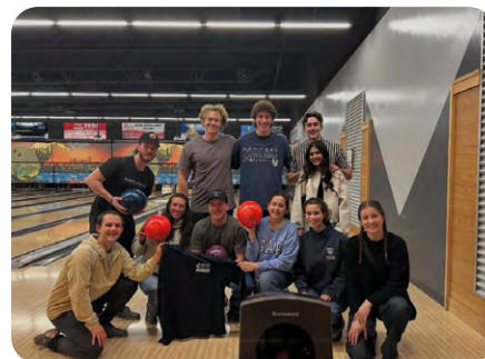
Section étudiante de l'Université de Victoria