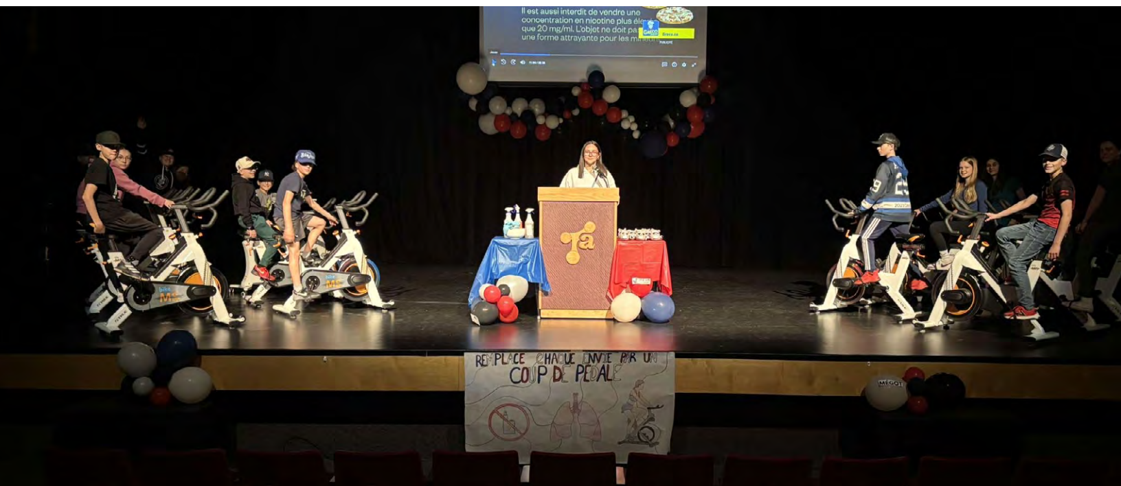
Une initiative MÉGOT dans une école encourage les élèves à remplacer le vapotage par l'activité physique.