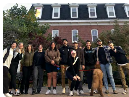
Section étudiante de l'Université St. Francis Xavier