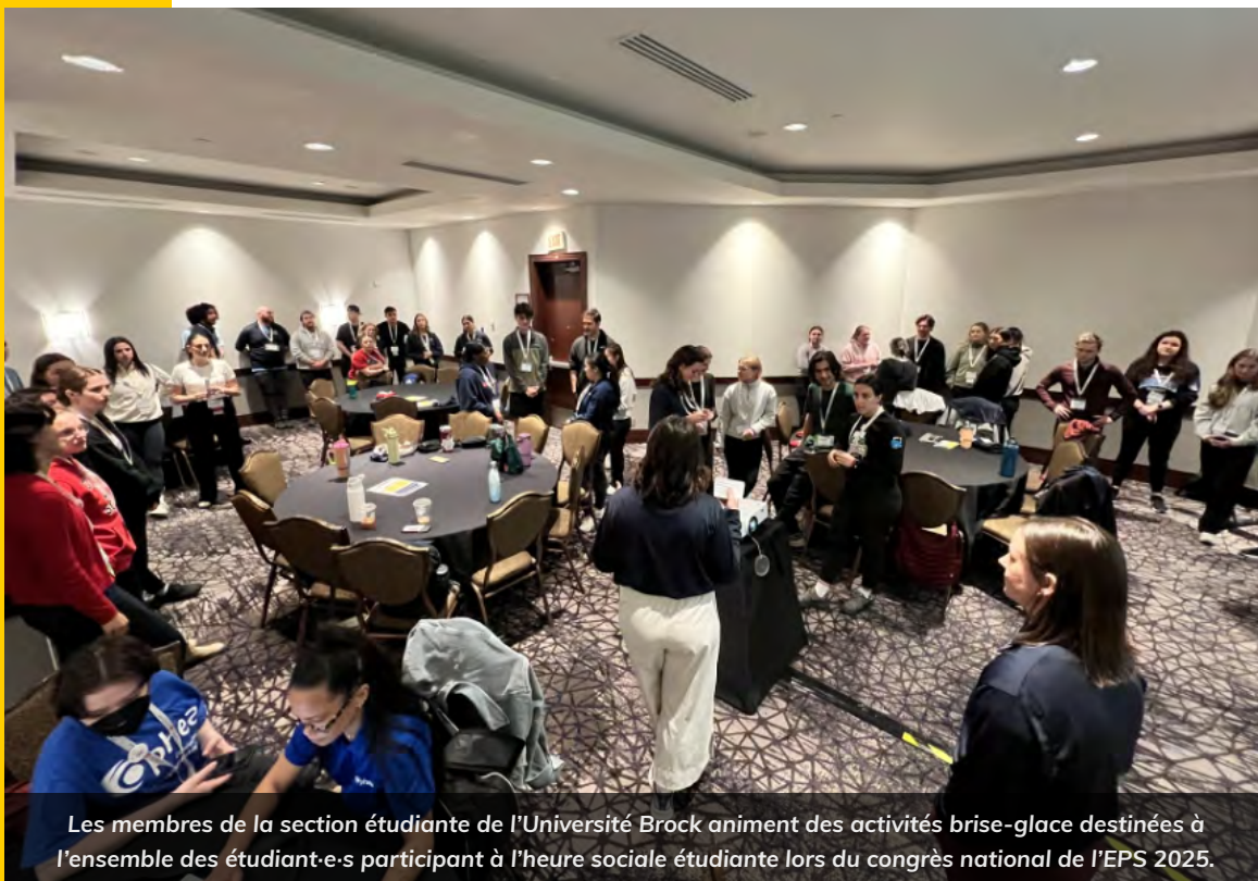
Les membres de la section étudiante de l'Université Brock animent des activités brise-glace destinées à l'ensemble des étudiant.e-s participant à l'heure sociale étudiante lors du congrès national de l'EPS 2025.