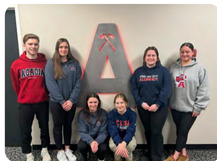
Section étudiante de l'Université Acadia