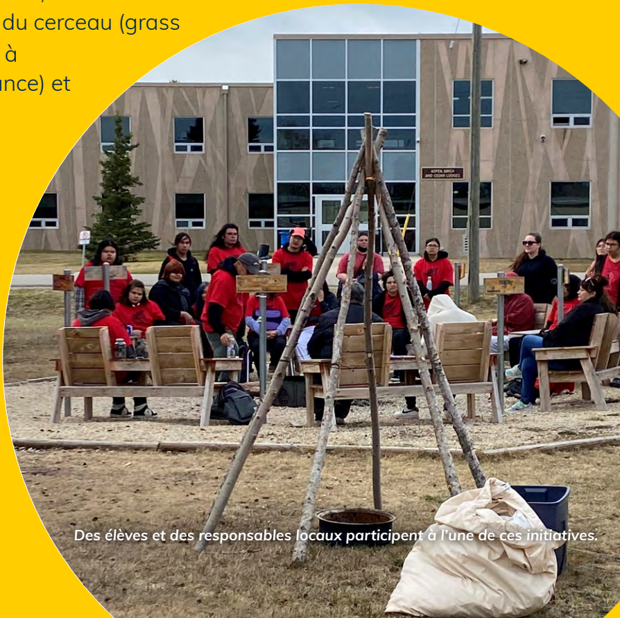
Des élèves et des responsables locaux participent à l'une de ces initiatives.