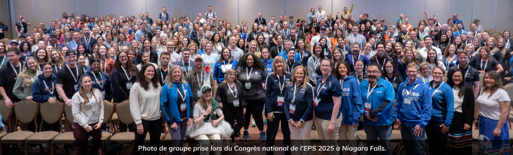
Photo de groupe prise lors du Congrès national de l'EPS 2025 à Niagara Falls.